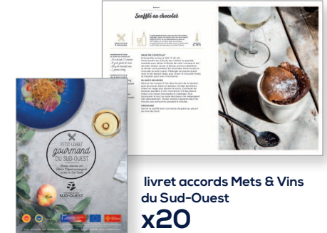
livret accords Mets & Vins du Sud-Ouest x20