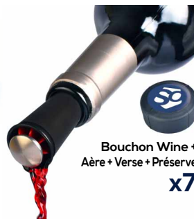
Bouchon Wine + Aère + Verse + Préserve x7

JEU CONCOURS sur Facebook Quizz flash pédagogiques & ludique sur les AOP & IGP des Vignobles du Sud-Ouest A GAGNER : 50 BOX* dégustation